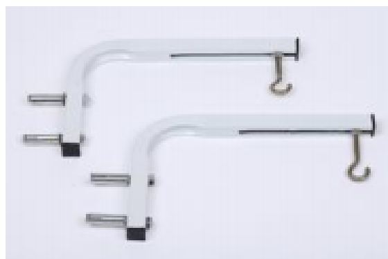
Support d'écran Mural/plafonnier