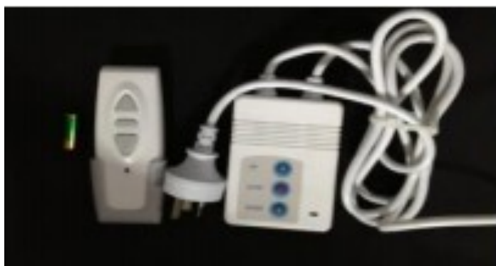
Télécommande infrarouge & boîtier de pilotage mural (Piles incluses)